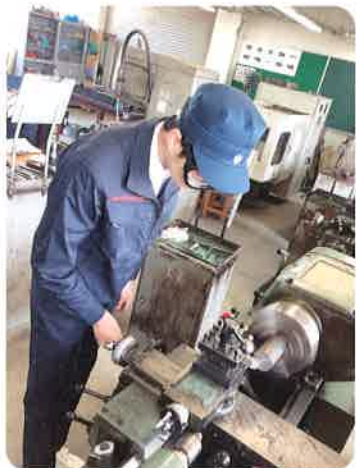
■ 機械技術コース(旋盤)