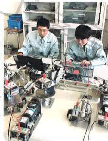
■ 生産プログラミングコース (シーケンス制御)