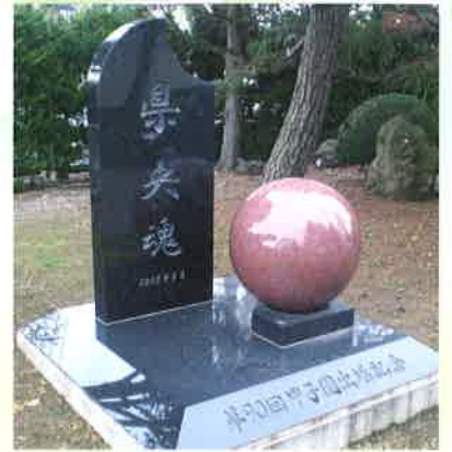
「第90回甲子園出場記念」