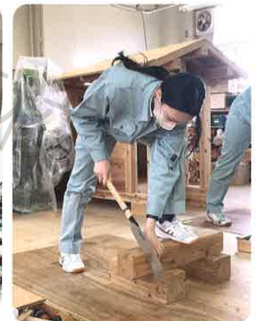
■ 建築コース(木材加工)