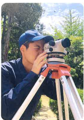
■ 都市防災コース(測量)