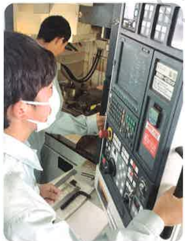
■ メカトロ技術コース (マシニングセンタ)